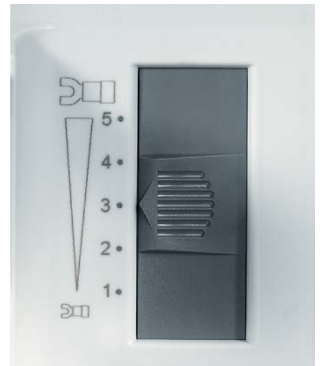
Der Presskraftbeginn ist einstellbar. The beginning of the press capacity is adjustable.