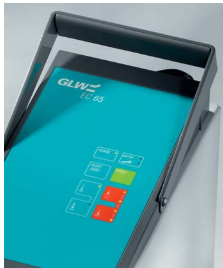
Der Tragegriff macht den EC 65 mobil. A handle makes the EC 65 portable.