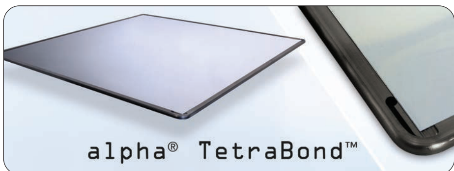
Bezrámové šablonové fólie ALPHA® TETRABOND™

Uspokojení současných vysokých nároků na tisk s rychlou odezvou, vysokou přesností, vynikajícím tiskovým výkonem a celosvětovou dostupností.